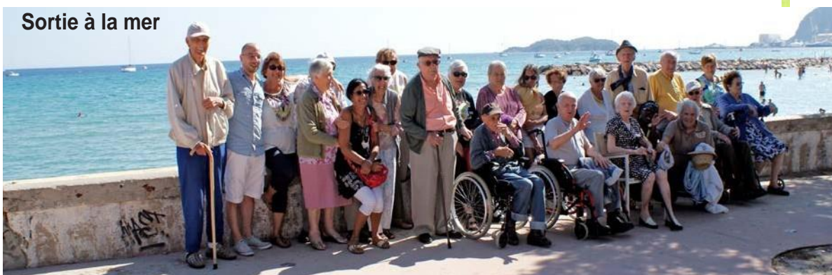
Sortie à la mer